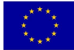
Euroopa Liit Euroopa Sotsiaalfond

Teadlike valikute tegemise audiovisuaalse õppematerjali loomist rahastati Euroopa Liidu struktuurivahenditest, meetme „Õppe seostamine tööturu vajadustega“ tegevuse „Ettevõtlikkuse ja ettevõtlusõppe süsteemne arendamine kõigil haridustasemetel“ taotlusvoorus „Koolide, kogukonna ja ettevõtjate koostöö toetamine ettevõtlusõppe praktilisemaks muutmiseks”.